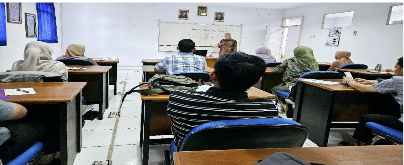
Gambar 4. Paparan Teknik Pengukuran Indeks Keterbukaan Informasi Publik.

Pada 13 Desember 2025, kegiatan dilanjutkan dengan sesi pengenalan Indeks Keterbukaan Informasi Publik. Pada tahap ini, peserta diperkenalkan pada konsep, indikator, serta metodologi pengukuran IKIP, termasuk dimensi pelayanan informasi, pemanfaatan media baru, dan partisipasi publik. Pemateri menjelaskan bahwa pengukuran indeks tidak hanya menilai kepatuhan administratif, tetapi juga kualitas akses, responsivitas layanan, serta keterlibatan masyarakat dalam proses evaluasi. Peserta mulai memahami pentingnya pendekatan berbasis data dan indikator terukur dalam menilai tingkat keterbukaan suatu badan publik.