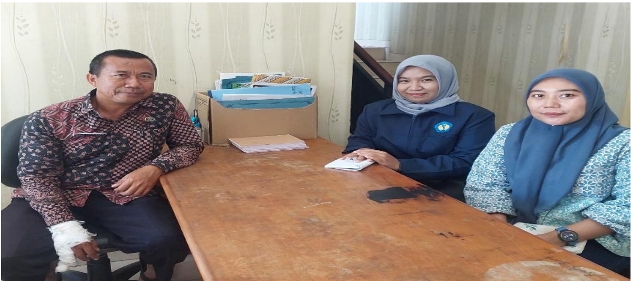
Gambar 1. Observasi dan Wawancara Persiapan Kegiatan

Pada 2 sampai 4 Desember 2025, tim menyusun dan mengolah data hasil observasi dan wawancara. Proses ini meliputi analisis kebutuhan (needs assessment), identifikasi kesenjangan pengetahuan, serta kajian literatur yang relevan dengan pengukuran Indeks Keterbukaan Informasi Publik, pelayanan informasi, media baru, dan partisipasi publik. Tahap analisis bertujuan untuk memastikan bahwa materi dan desain program kerja berbasis pada kondisi riil mitra, sekaligus memiliki landasan konseptual dan normatif yang kuat.