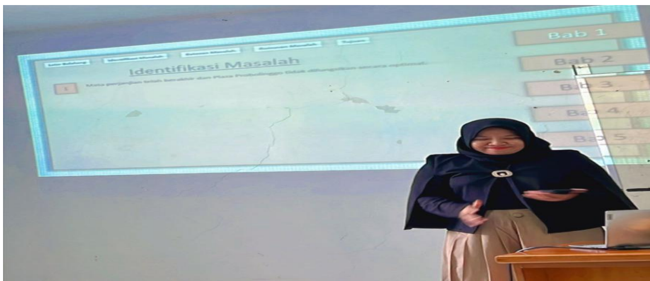
Gambar 5. Praktik Pengukuran Indeks Keterbukaan Informasi Publik.

Pada 20 Desember 2025, dilaksanakan praktik langsung pengukuran Indeks Keterbukaan Informasi Publik. Peserta dibagi dalam beberapa kelompok kecil untuk melakukan simulasi penilaian berdasarkan instrumen yang telah disusun. Kegiatan ini mencakup identifikasi indikator, penyusunan lembar evaluasi, serta analisis hasil penilaian secara sederhana. Praktik ini menjadi tahap paling aplikatif karena peserta secara langsung mengalami proses asesmen, diskusi perbedaan persepsi penilaian, dan penyusunan rekomendasi perbaikan. Hasil praktik menunjukkan peningkatan kemampuan analitis peserta dalam menilai aspek transparansi dan kualitas pelayanan informasi.