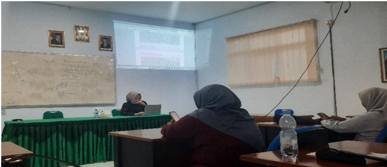
Gambar 3. Paparan Materi Keterbukaan Informasi Publik.

Pada 9 Desember 2025, dilaksanakan seminar umum keterbukaan informasi publik yang bertujuan memberikan penguatan konseptual mengenai prinsip, dasar hukum, dan urgensi transparansi dalam tata kelola pemerintahan. Materi seminar mengulas implementasi keterbukaan informasi berdasarkan Undang-Undang Nomor 14 Tahun 2008 tentang Keterbukaan Informasi Publik, termasuk hak dan kewajiban badan publik serta masyarakat. Diskusi interaktif menunjukkan tingginya antusiasme peserta, terutama dalam membahas relevansi keterbukaan informasi dengan isu kebijakan publik dan pelayanan publik di tingkat kabupaten.