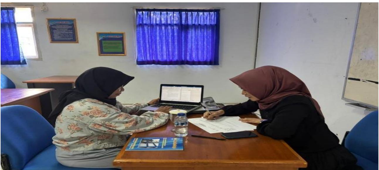
Gambar 2. Penyusunan Kegiatan Edukasi

Pada 5 sampai 6 Desember 2025, tim merancang program kerja pengabdian berdasarkan hasil analisis sebelumnya. Perancangan mencakup penyusunan modul edukasi, metode pelaksanaan (ceramah interaktif, diskusi kelompok, dan simulasi instrumen pengukuran), serta indikator keberhasilan kegiatan. Dengan jumlah mitra sebanyak 25 orang, desain kegiatan disusun secara partisipatif agar memungkinkan interaksi yang intensif, pendalaman materi, serta praktik langsung penyusunan instrumen evaluasi.